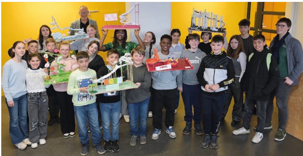
Schülerinnen und Schüler aus der Klassenstufe 5 des Alexander-von-Humboldt-Gymnasiums gewinnen mit ihren Achterbahnmodellen einen Gestaltungspreis.

Weitere Informationen: www.ikhb.de/junioring