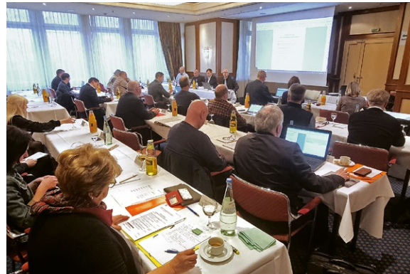
Blick in die Teilnehmerrunde der 44. VG-Sitzung