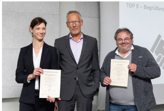
Zu Beginn der Wahl-Kammerversammlung bekamen zwei neue Kammermitglieder ihre Mitglieds-Urkunden persönlich überreicht. Der Zuwachs wurde freudig in der Ingenieurkammer Bremen begrüßt.