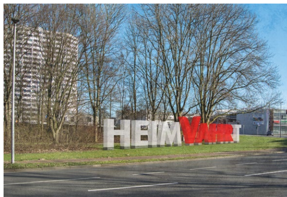
Visualisierung Schriftzug Bischof-Ketteler-Straße