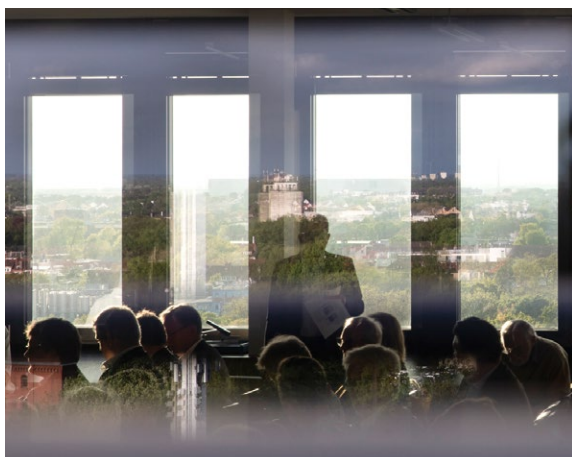
Die Kammerversammlung und Wahl des Vorstands fand bei guter Aussicht im 10. Stock des AB-Trakts der Hochschule Bremen statt.